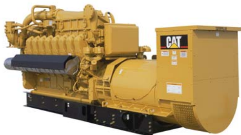
Генераторная установка показана с оборудованием, устанавливаемым по специальному заказу